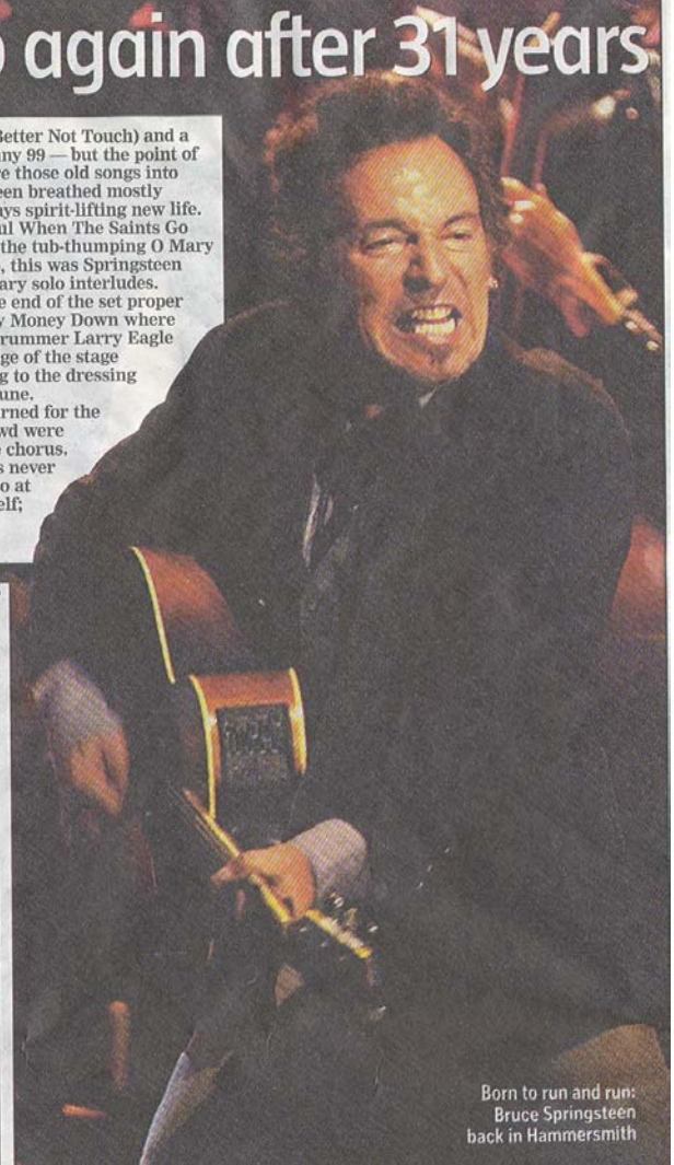
Born to run and run: Bruce Springsteen back in Hammersmith

Voted World's Best Business Class 3rd year running.