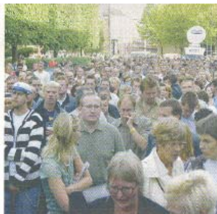
Skrivningen var afskåret for koncerten.

Men når Bossen så knælede sig over mange som "Spent In The Night", "I'm On Fire", "Badlands" eller en total fornyet version af